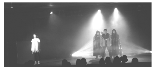
vol. 30「永遠の嘘をついてくれ」舞台写真