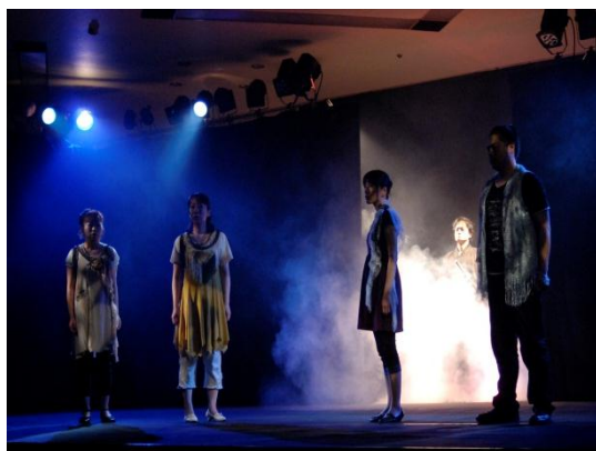
2010年 vol. 33 「明日へのレクイエム」 作・演出 赤松美花