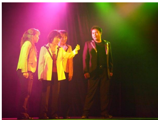
2011年 vol. 34 「good-good bye」 作・演出 加藤孝明